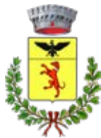
COMUNE di Calvisano