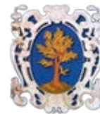
COMUNE di Castenedolo