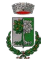
COMUNE di Remedello