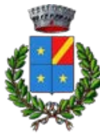
COMUNE di Capriano del Colle