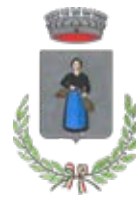
COMUNE di Acquafredda